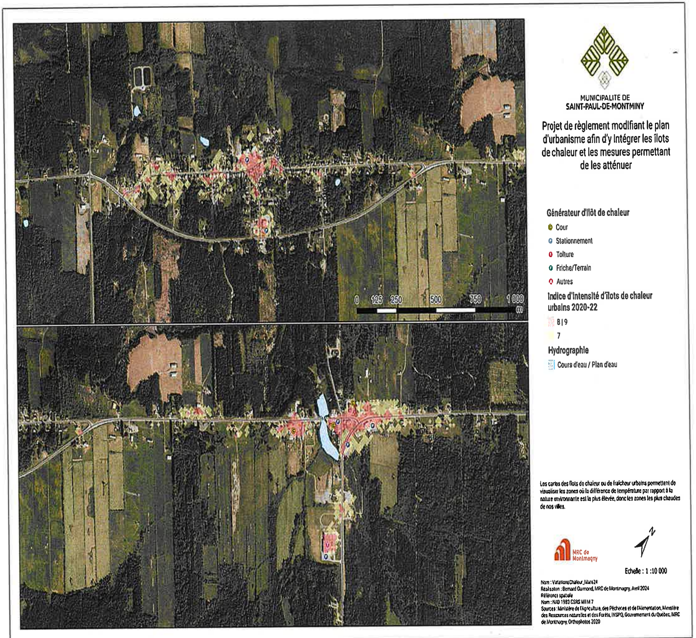
Annexe 2 – Zones susceptibles au phénomène d'îlot de chaleur

Le Plan d'urbanisme en vigueur est modifié par l'ajout de l'annexe 2 intitulé « ZONES SUSCEPTIBLES AU PHÉNOMÈNE D'ÎLOT DE CHALEUR ».